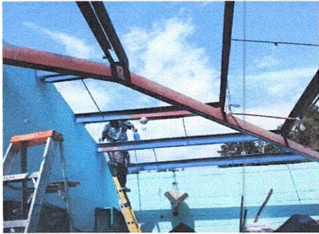
Foto1: Pintada de costaneras